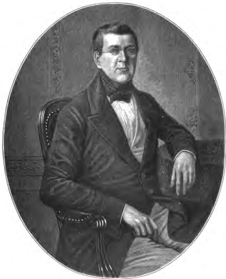
ГРАФЪ ВИКТОРЪ НИКИТИЧЪ ПАНИНЪ.